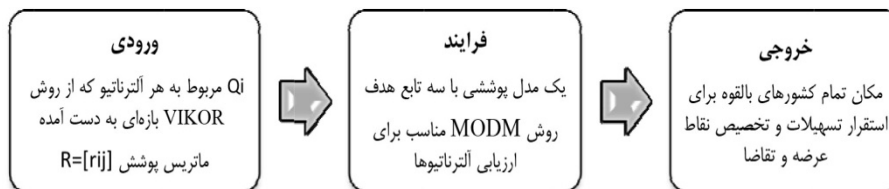
شکل ۳. فاز سوم روش از دیدگاه سیستماتیک بازه‌ای

تابع هدف اول تضمین می‌کند حداقل تعداد کارخانه تأسیس شده است. تابع هدف دوم با کمیته‌سازی مقدار Q_i که در مرحله قبل از روش ویکور بازه‌ای به دست آمد، مطلوبیت کشورهای بالقوه را برای استقرار تسهیلات بیشینه می‌کند. تابع هدف سوم به کمیته‌سازی هزینه حمل‌ونقل در تخصیص کشورهای حمایت‌کننده ( i ) و کشورهای حمایت‌شونده ( z ) می‌پردازد. در این تابع هدف، عدد ۲۰ ضریب هزینه ثابت حمل‌ونقل میان هر مبدأ و مقصد است. محدودیت اول برای این است اگر مبدأ i وجود داشته باشد و این مبدأ در تخصیص‌های صورت‌گرفته انتخاب نشود، مقصدی نیز برای این مبدأ وجود نخواهد داشت؛ بنابراین، متغیر تخصیص به آن صفر در نظر گرفته می‌شود. محدودیت دوم برای این است که به‌ازای هر مقصد یک مبدأ در نظر گرفته شود. محدودیت سوم مربوط به رعایت شعاع پوشش در انتخاب مسیر است. در این محدودیت A = [a_{ij}] ، ماتریس پوشش نامیده می‌شود. محدودیت چهارم مربوط به رعایت ظرفیت عرضه مبدأهاست و اینکه مجموع تقاضای مقصدها از مجموع عرضه مبدأها بیشتر نباشد.