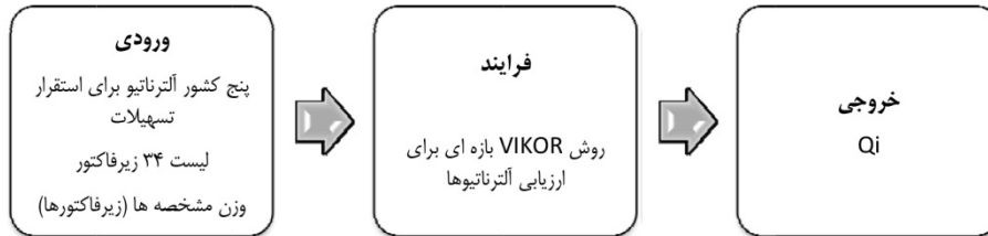
شکل ۲. فاز دوم روش از دیدگاه سیستماتیک