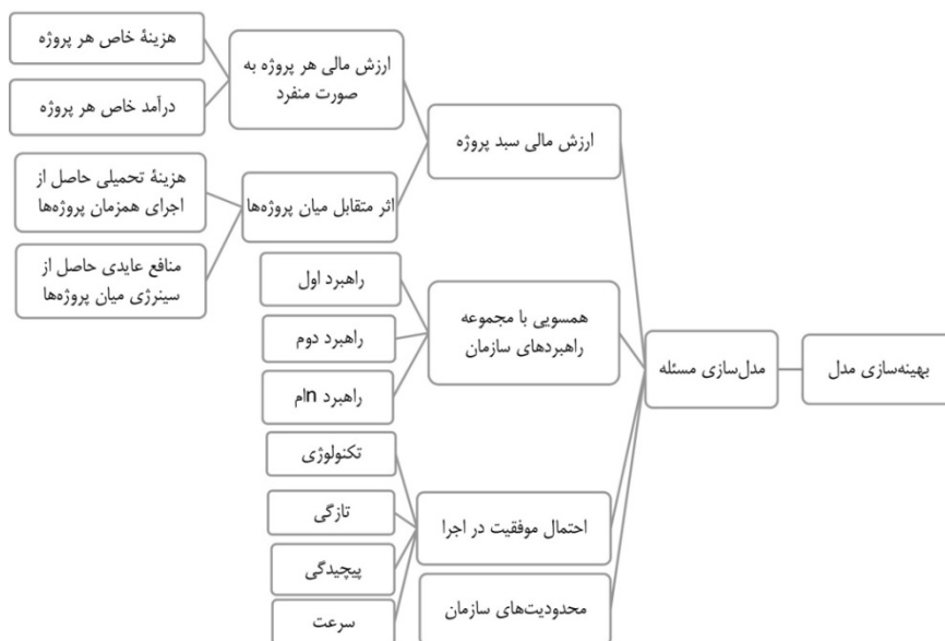
شکل ۱. مدل مفهومی

مسئله انتخاب و بهینه‌سازی سبد پروژه به‌طور کلی به دنبال انتخاب مجموعه مناسب و محدودی از پروژه‌های پیشنهادی است، به طوری که ضمن تأمین اهداف چندگانه سازمان بر محدودیت‌های موجود فائق آید. در این مقاله سعی شده با ادغام معیارها و اهداف اصلی ارائه‌شده توسط کوپر و ایجت (۲۰۰۸) و شنهار، دویر، لوی و مالتز (۲۰۰۱) مسئله انتخاب سبد پروژه مدل‌سازی و سپس با استفاده از الگوریتم خود بهینه مبتنی بر آموزش و یادگیری بهینه‌سازی شود.