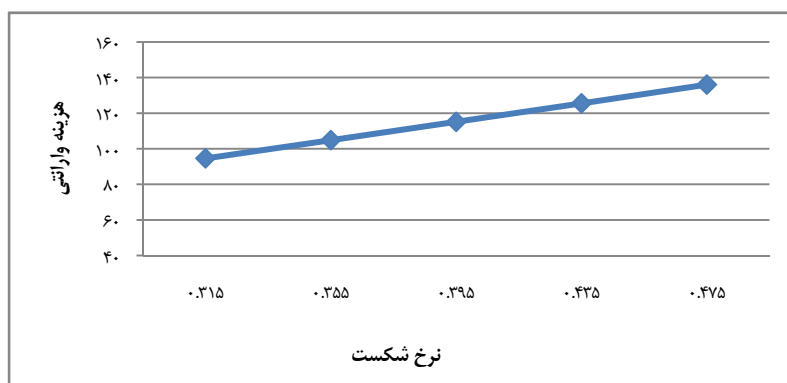
شکل ۳. هزینه مورد انتظار وارانتهی برای تولیدکننده به ازای مقادیر متفاوت نرخ شکستگی